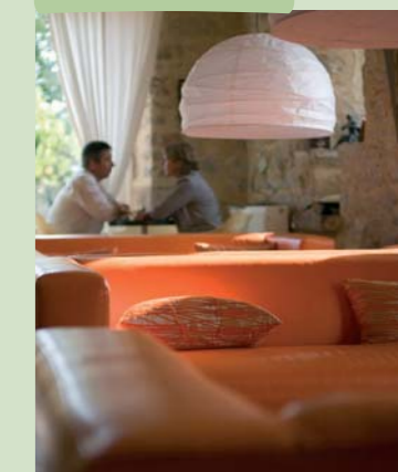
Hôtel La Grézalide à Grèzes