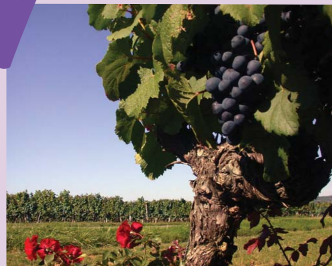
Château Gaudou à Vire/Lot

Informations : Loisirs accueil Lot 05 65 53 20 90 loisirs.accueil.lot@wanadoo.fr