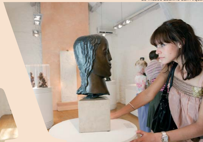
Le musée Zadkine aux Arques