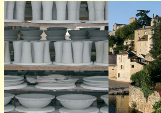
Porcelaine Virebent à Puy l'Evêque

Informations : Loisirs accueil Lot 05 65 53 20 90 loisirs.accueil.lot@wanadoo.fr