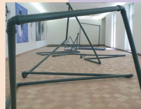
Maison des Arts Pompidou à Cajarc

Thomas Kervel ne jure que par le Quercy. Voilà quelques mois, il a décidé de vivre de son art à Sauzet où il conçoit des meubles et objets d'une grande modernité tels ses fauteuils club. Le « tôle art » de Sauzet n'est prisonnier d'aucun concept et n'en finit pas d'imaginer de nouveau mobilier. Un artisan du fer à la personnalité bien trempée !