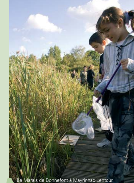
Le Marais de Bonnefont à Mayrinhac Lentour