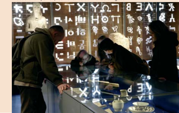
Musée Champollion, les Écritures du Monde à Figeac

Informations : Loisirs accueil Lot 05 65 53 20 90 /// loisirs.accueil.lot@wanadoo.fr