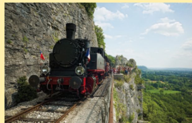
Martel - "Truffadou" train touristique