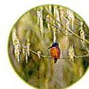
Le martin pêcheur