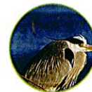
Le héron cendré