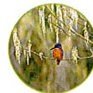
Le martin pêcheur