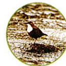
Le cincle plongeur